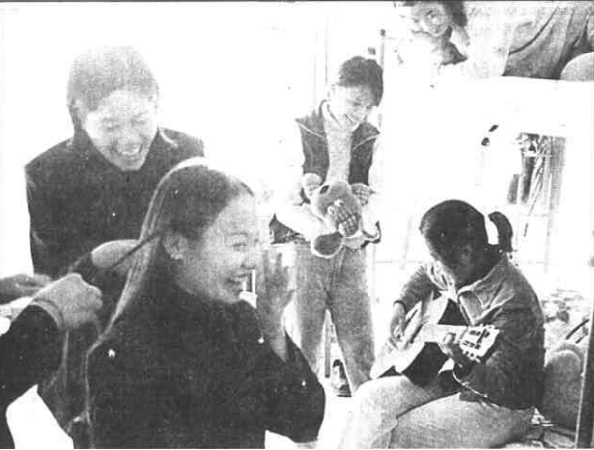
平均年龄21岁，一个如花的季节，她们用美丽装扮着自己的“女儿村”。