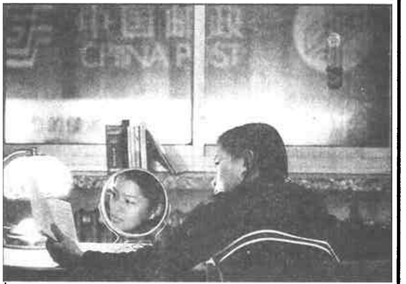
正在实习期的小彭姑娘深知，只有努力学习，提高自身综合素质，才能成为人才竞争激烈的“女儿村”的合格公民。