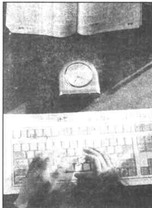
每分钟准确无误地敲打80个字以上，这是寻呼小姐的基本功。