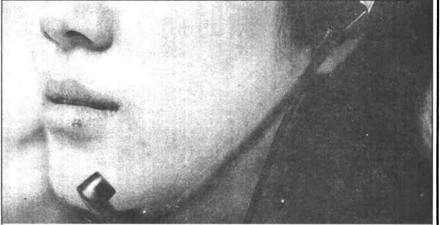
寻呼小姐每班6小时，平均处理700多个电话，嘴生燎泡、咽喉肿痛已是常事儿，但她用100%的投入承诺着：创造一个没有距离的世界